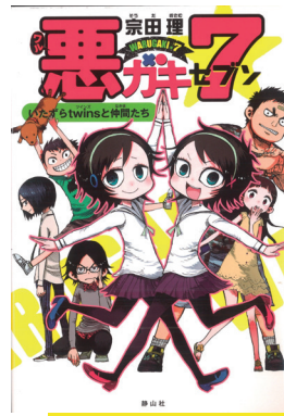
『悪ガキ7 いたずらtwinsと仲間たち』 宗田理：著 中山敦史：絵 静山社