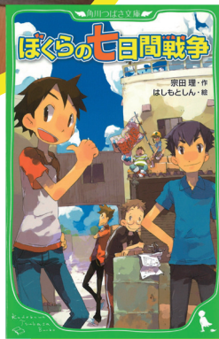
『ぼくらの七日間戦争』 宗田理：著 はしもとしん：絵 KADOKAWA/角川つばさ文庫

手に取って読むことができるので、お気に入りの1冊を見つけたり、読書感想文などの参考にもどうぞ!!