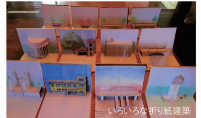
いろいろな折り紙建築