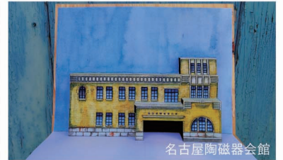
名古屋陶磁器会館